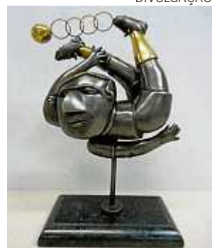
Peça em bronze estava em exposição no aeroporto